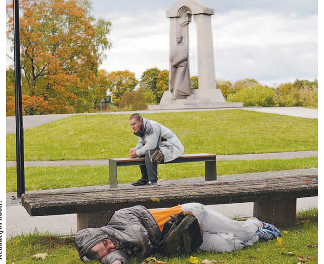
Vaidai Anykščiuose liudija, kad girtavimas neaplenkė ir mūsų krašto. Girtuoklių nedrausmina net akmeninis vyskupas Antanas Baranauskas, rūsčiai nuo pastamento žvelgiantis į linksmybes.