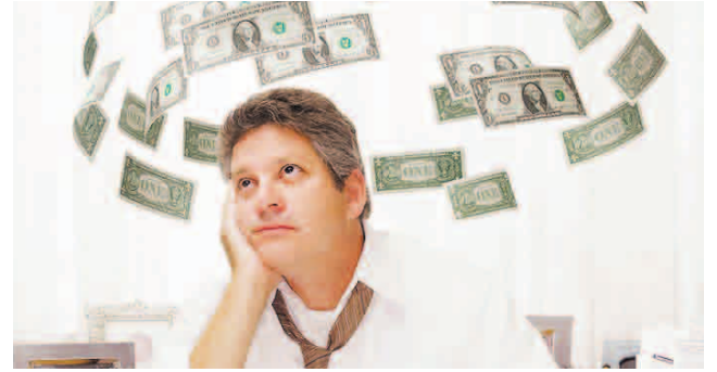
Pagal įmonių skaičiaus augimo tempus pernai išsiskyrė tik Anykščiai.

Utenos apskrityje verslininkai labiau nei kituose šalies regionuose išgyvena dėl klientų trūkumo bei augančios konkurencijos, o mažų ir vidutinių įmonių skaičius beveik visose regiono savivaldybėse auga lėčiau. Keturiolika iš šešių