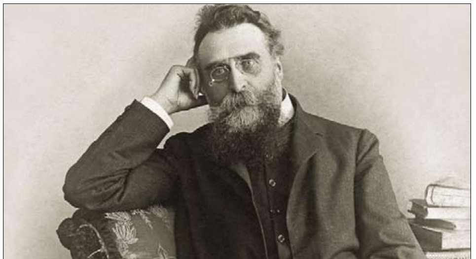
Dr. Jonas Basanavičius