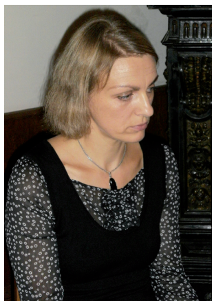
Romano aut. J. Žąsinaitė