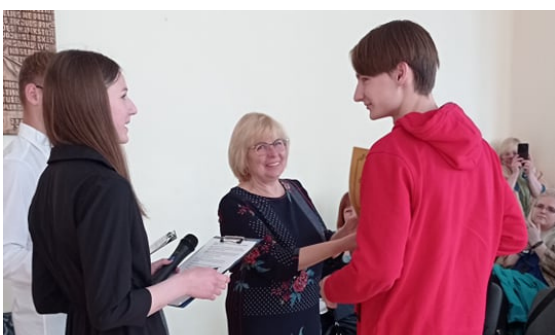
Akimirkos iš renginio.

Tikime, kad džiugi nuotaika, kurią kūrėme šventėje, lydės ir kasdienybėje.