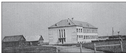
Pirmasis Svėdasų gimnazijos pastatas