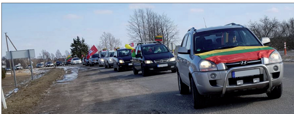
Važiuotynės Svėdasuose Lietuvos nepriklausomybės atkūrimo dienai paminėti

Neatsiliko ir svėdasiškiai: šventinėse važiuotynėse dalyvavo apie 20 automobilių. Skambant muzikai, laikydami kelių eismo taisyklių, dalyviai važiavo Svėdasų miestelio gatvėmis, automobilius papuošę tautine simboliška. Važiuotynes organizavo Anykščių naujų vėjų bendruomenė, Anykščių kultūros centro Svėdasų skyrius, Svėdasų seniūnija ir asociacija „Svėdasų bendruomenė“.