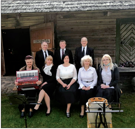
AKC Svėdasų skyriaus meno mėgėjų kolektyvas

Taip ilgai laukiame to, kas tiesiog lėkte pralekia! Štai, jau birželio vidury.