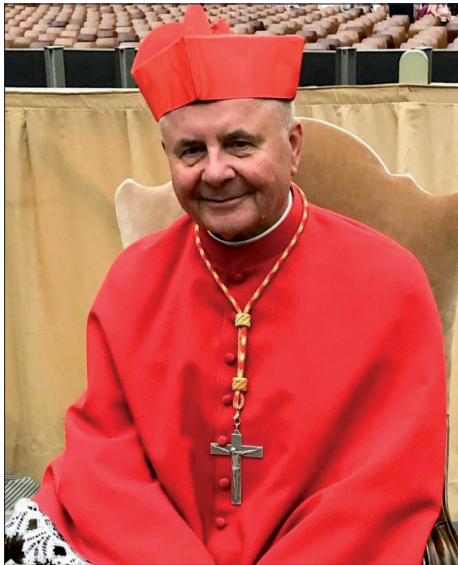
Kardinolas Sigitas Tamkevičius

Ši istorija su nusivylusiais Jėzaus mokiniais yra svarbi net keliais atžvilgiais. Ji kalba apie tai, kad Dievu ir savo tikėjimu galima nusivilti. Nusiviliama visuo-