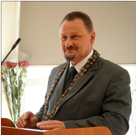
Anykščių rajono meras Sigutis Obelevičius

Anykščių rajono meras Sigutis Obelevičius antrame rinkimų ture gavo 63,8 proc. rinkėjų balsų. Jis Anykščių rajono tarybai vadovavo dvi kadencijas – 2007–2011 m. ir 2011–2015 m. Dabar jis vadovaus trečią kadenciją 2019–2023 m. Šiai kadencijai sudaryta rajono Taryba turės 19 balsų valdančiąją koaliciją, kuri bus pajėgi spręsti Anykščių rajono gyventojų problemas ir numatyti priemones tolesniam miesto ir rajono vystymui. Tarybos sudėtį papildė 8 politikoje nebuvę deputatai.